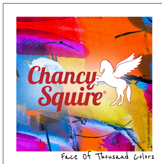
Album Cover:

Rechtzeitig zum 45. Bandjubiläum bringt Chancy Squire das neue Album „Face Of Thousand Colors“ heraus – vorerst online released. Dieses Album reflektiert die vielfältigen Farben mit denen das Leben malt. Nach ihrem in Nashville produzierten Album „For A Better World“ und dem zweiten Album „Here We Go Again“ präsentiert sich mit dem neuen dritten Album ein weiterer Meilenstein ihrer musikalischen Karriere. Jede freie Minute wurde investiert, um ein Werk zu erschaffen, auf dass die stetig wachsende internationale Fangemeinde seit langem gewartet hat. Insgesamt dreizehn Songs mit den für Chancy Squire typischen, eingängigen Melodien und philosophischen Texten für eine bessere Welt, füllen das Album.